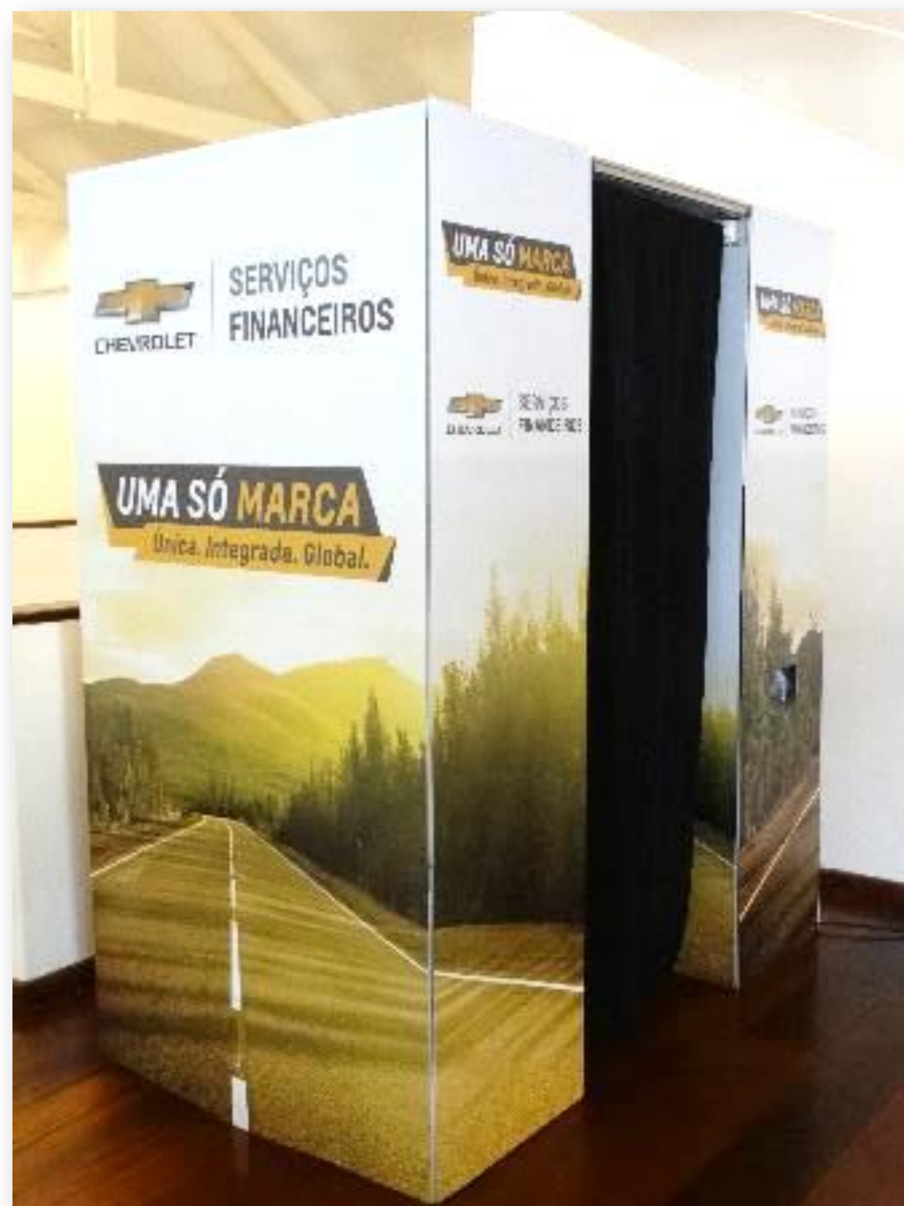
Cabine de Fotos – Evento de Ativação