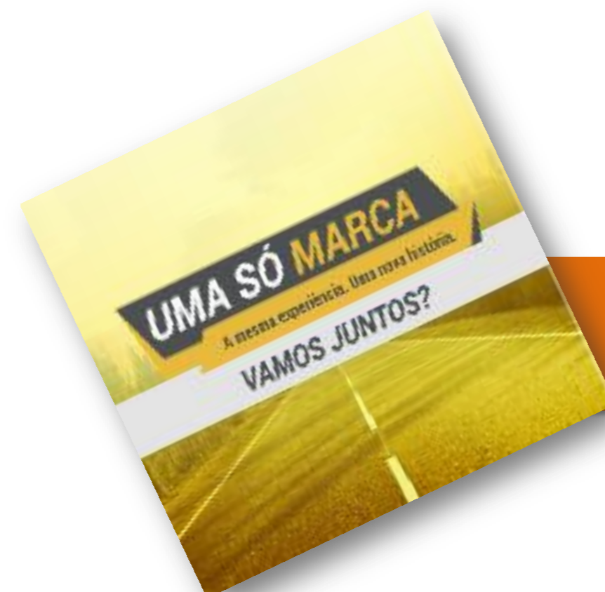
Teaser para anúncio oficial