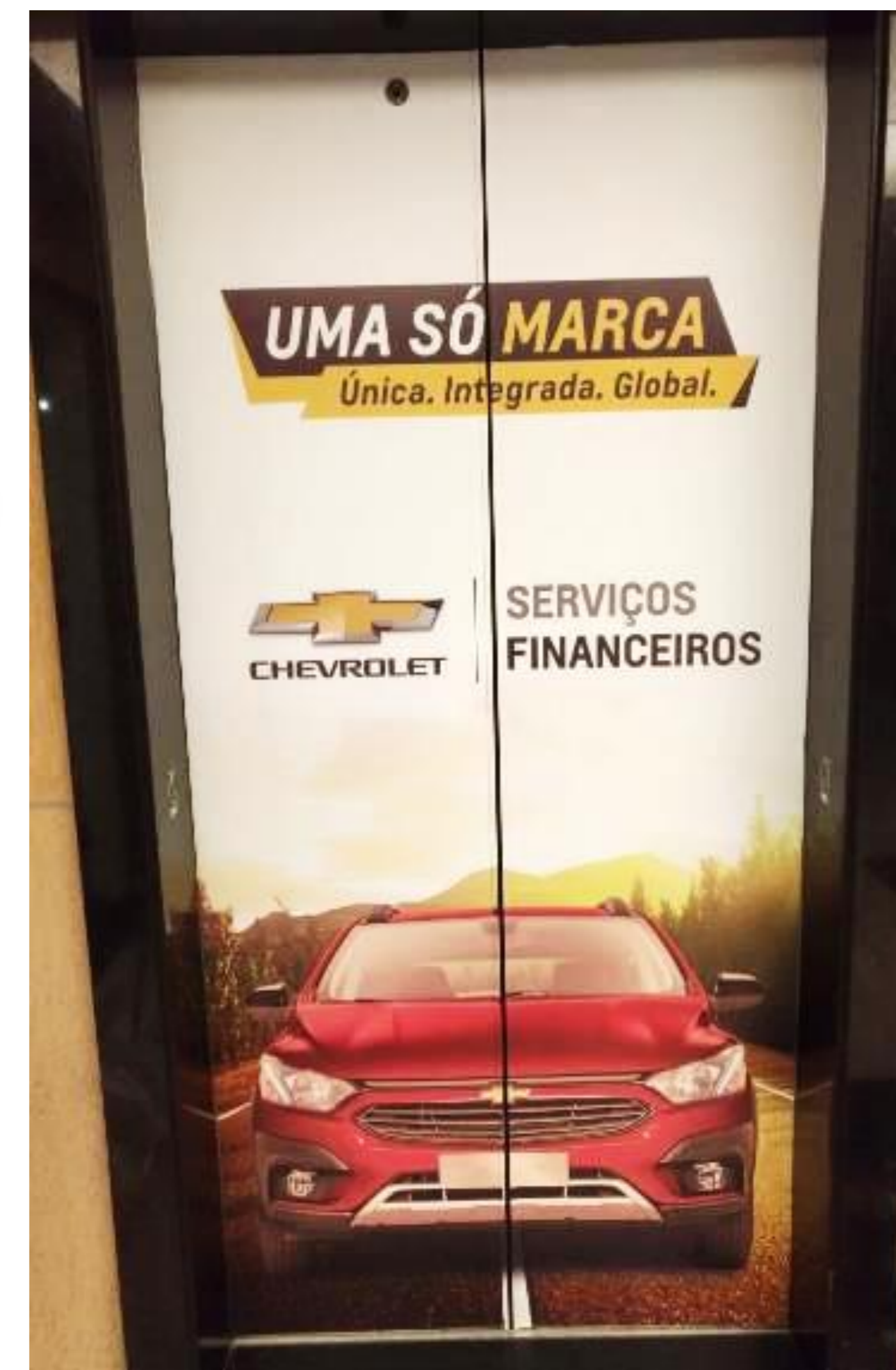
Adesivo de Elevador - Sede