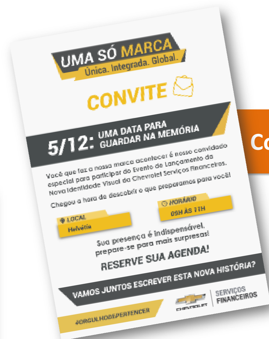
Convite para evento de ativação